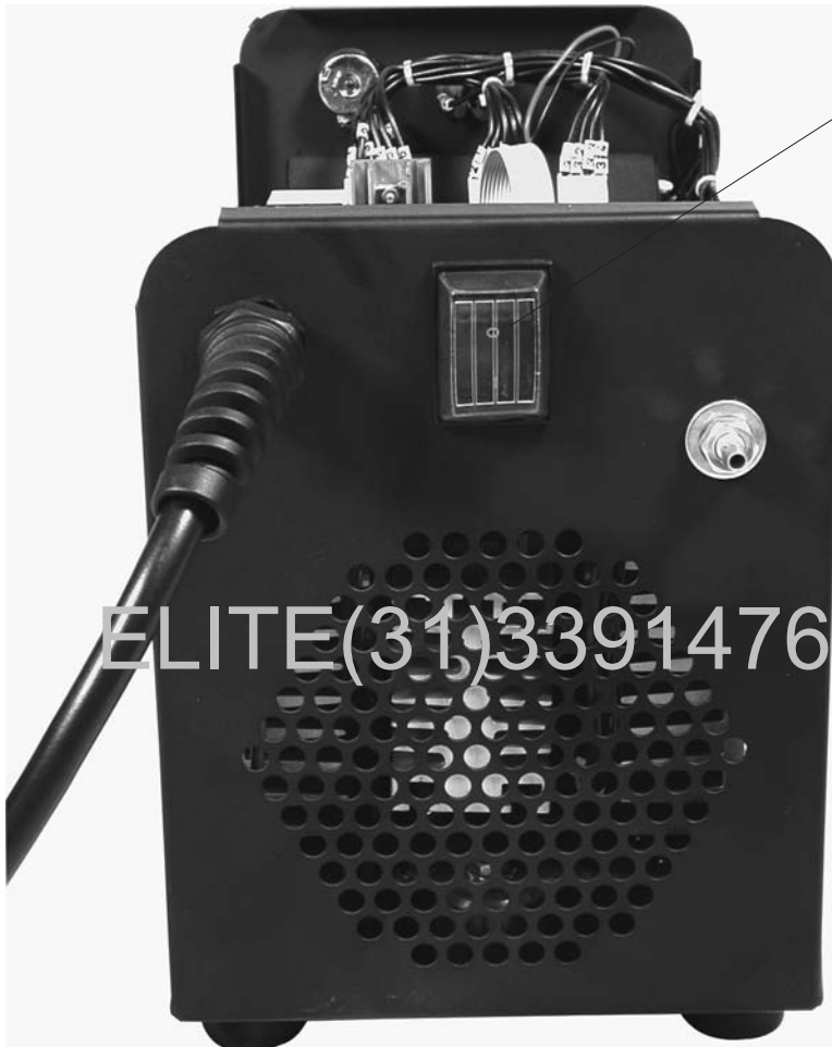
16 CHAVE LIGA / DESLIGA